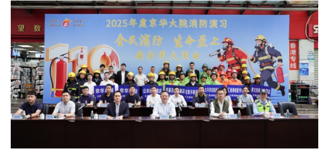
(黄安、梁艺琳文/齐楠、张爱萍图)